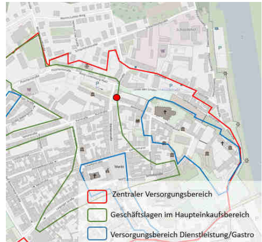
© OpenStreetMap-Mitwirkende / Quelle: Einzelhandels- und Zentrenkonzept für die Große Kreisstadt Torgau, BBE 2016)